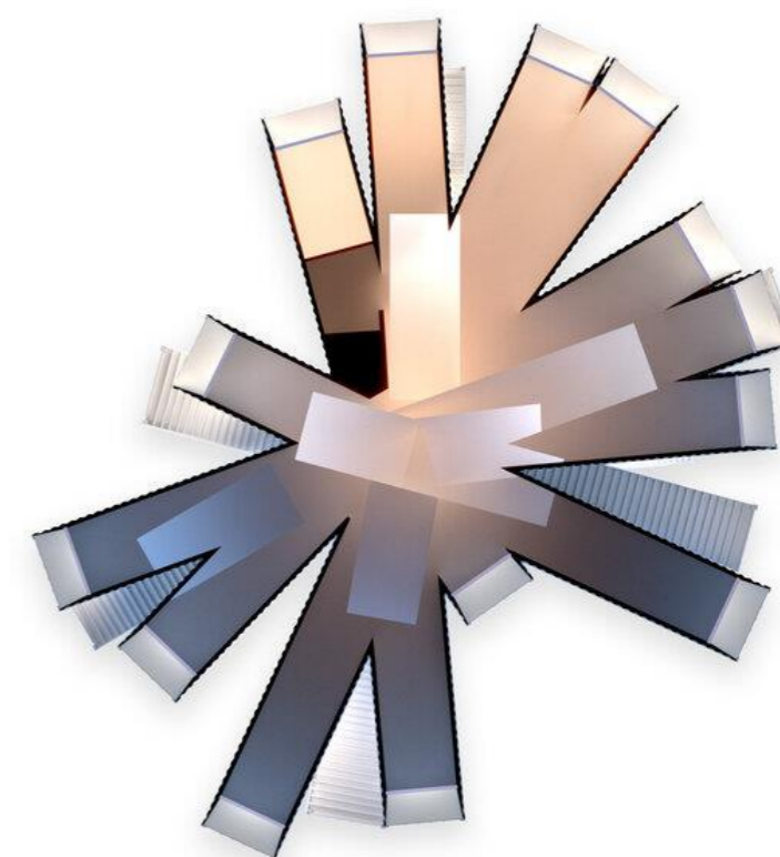
Joshua Tree Residence/Whitaker Studio