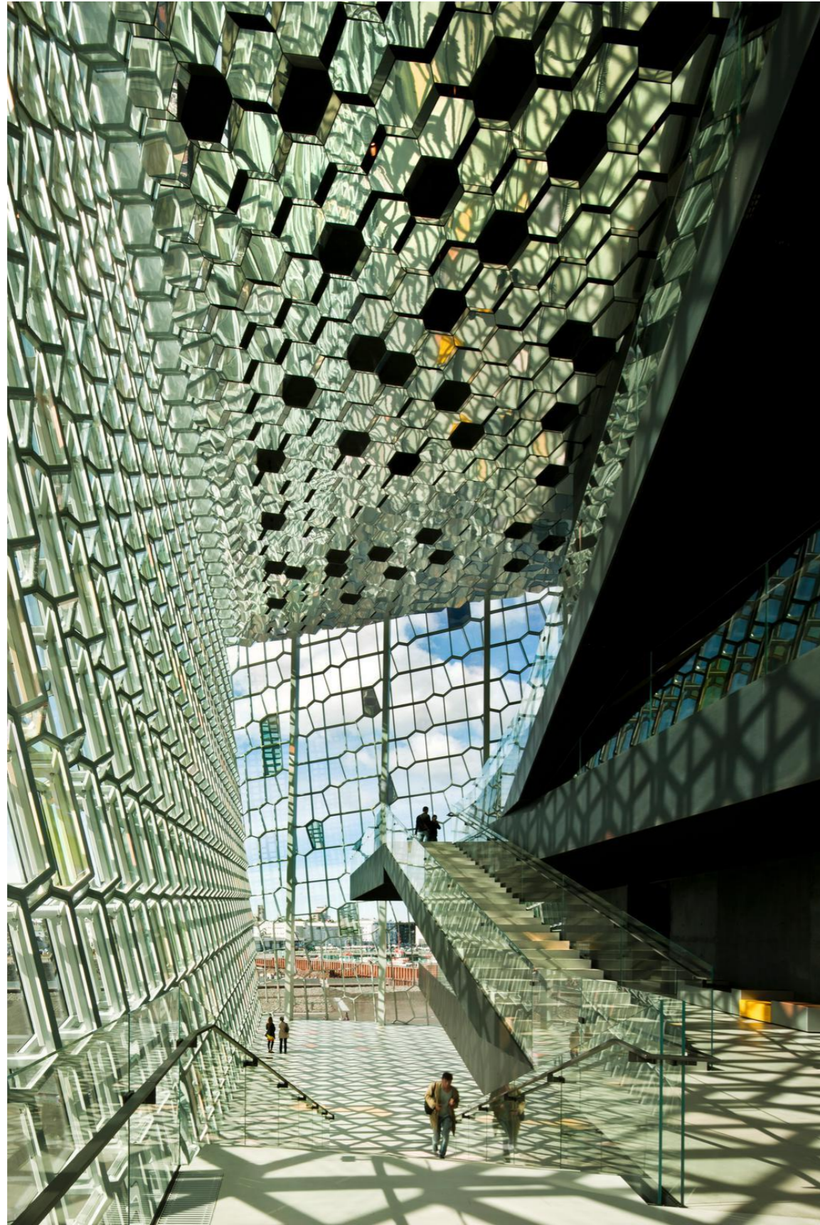
Harpa Reykjavik Concert Hall and Conference Centre, 2005-2011